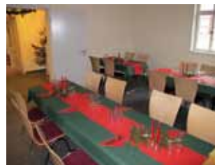
Festtafel im Erdgeschoss