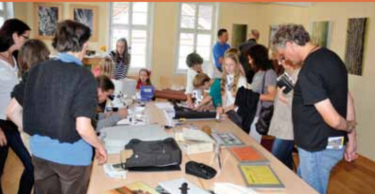
Ausstellung im Obergeschoss