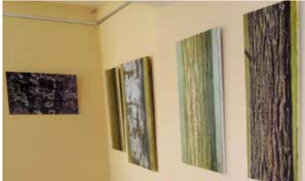
Bildausstellung zu naturkundlichen Themen

Nur wenige Meter entfernt vom Alten Rathaus bieten die „Pension Zum Weißen Ross“ und die „Pension Assenheim“ Übernachtung und Frühstück an.