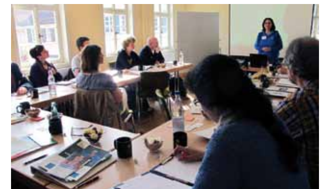
Seminargruppe im Obergeschoss