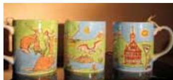
Im NABU-Shop im Alten Rathaus erhältlich: Das Heft zur Geschichte des Gebäudes und die handbemalte Tasse mit Naturmotiven und dem Alten Rathaus. Ideale „Fanartikel“ und eine schöne Erinnerung für Ihre Gäste.