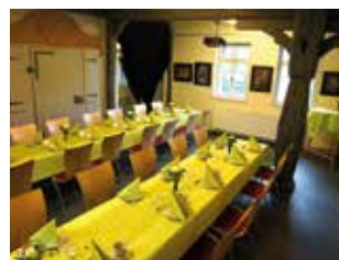
Festtafel im Erdgeschoss

Auf Wunsch unterstützen wir Sie bei der Planung und Organisation Ihrer Veranstaltung und kümmern uns um das Catering.