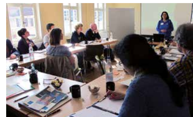
Seminargruppe im Obergeschoss

Das Alte Rathaus befindet sich mitten im Ortskern an der Durchgangsstraße. In der Altstadt selbst darf nur in den gekennzeichneten Bereichen geparkt werden. Direkt vor dem Haus steht nur ein Behindertenparkplatz zur Verfügung, der kurzzeitig auch zum Be- und Entladen genutzt werden kann. Hinter dem Haus ist Parkverbot. Es empfiehlt sich auf die im Plan auf der Rückseite gekennzeichneten Parkplätze auszuweichen. Von dort ist das Alte Rathaus in drei Minuten zu Fuß zu erreichen.