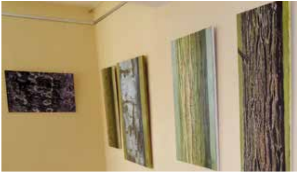
Bildausstellung zu naturkundlichen Themen