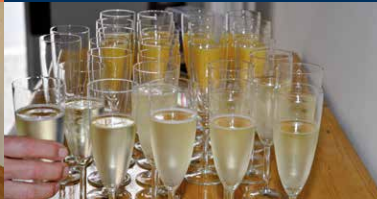
Sektempfang im Foyer