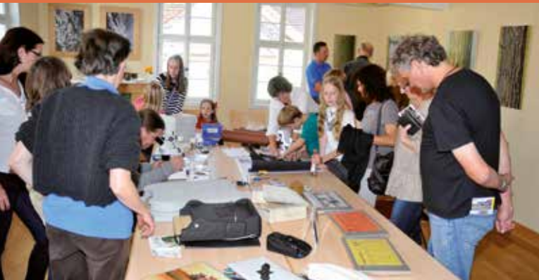
Ausstellung im Obergeschoss