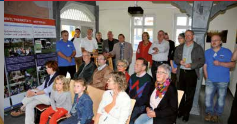
Vortrag im Erdgeschoss